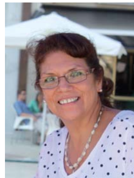
Erika Wiener Chile Fotógrafa