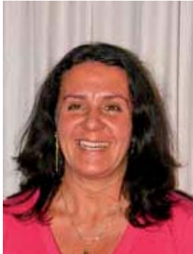
Aurora Alvarez España Comercial Import-Export